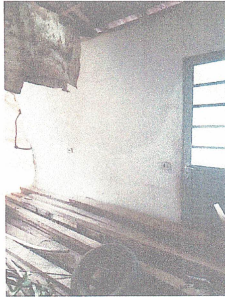
Foto 03: parede do lado direito da cozinha, atingida parcialmente