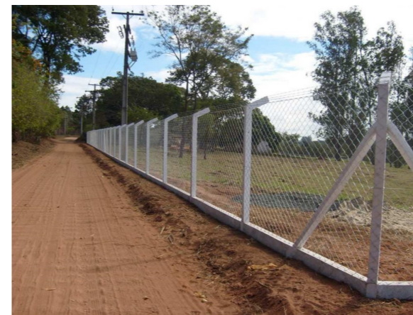
EXEMPLO DE ALAMBRADO - SEM ESCALA