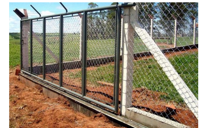
EXEMPLO DE PORTÃO DE CORRER- SEM ESCALA