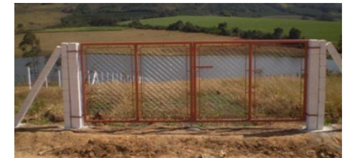
EXEMPLO DE PORTÃO DE ABRIR- SEM ESCALA